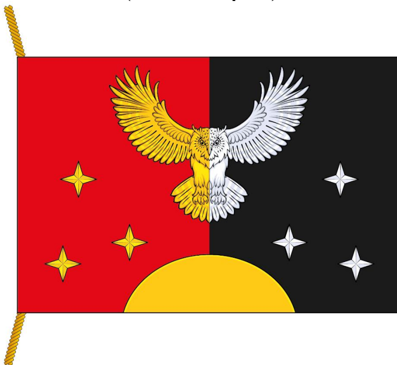
РИСУНОК ФЛАГА МУНИЦИПАЛЬНОГО ОКРУГА ГАГАРИНСКИЙ В ГОРОДЕ МОСКВЕ (лицевая сторона)

Приложение к Положению «О флаге муниципального округа Гагаринский в городе Москве»