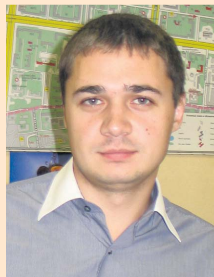
Интервью с заместителем руководителя муниципалитета Гагаринский

Во всех странах в первый учебный день не проводятся занятия: ученики играют в игры или слушают занимательные истории и рассказы учителей.