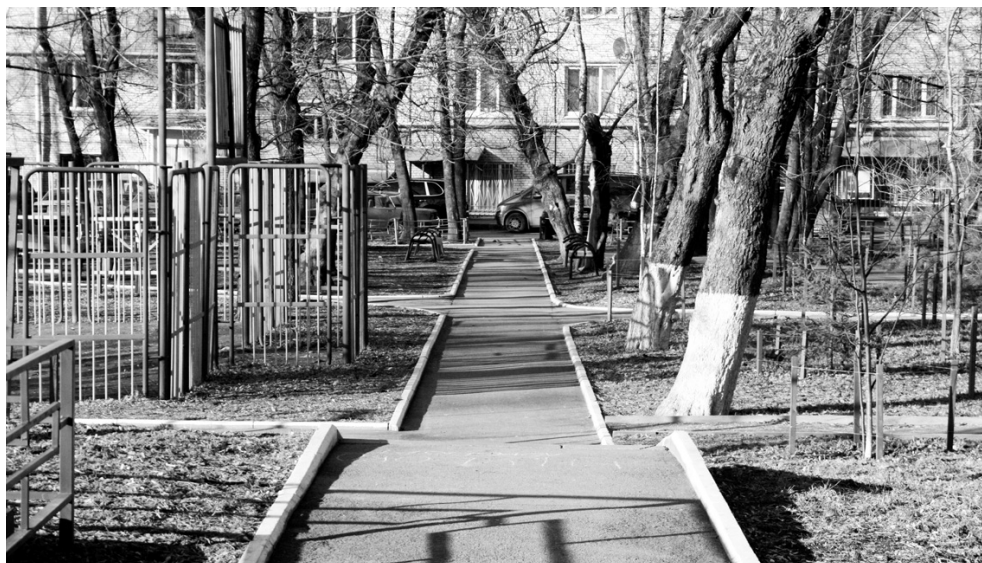
Двор дома № 40 по Ленинскому проспекту

Сегодня посадка деревьев жестко регламентирована. Она должна осуществляться по проекту, прошедшему необходимые согласования. Но если еще несколькими годами раньше озеленением в Москве занимались специалисты Мосзеленхоза, то теперь эта деятельность отдана на откуп различным фирмам и фирмочкам, а также организациям по эксплуатации жилищного