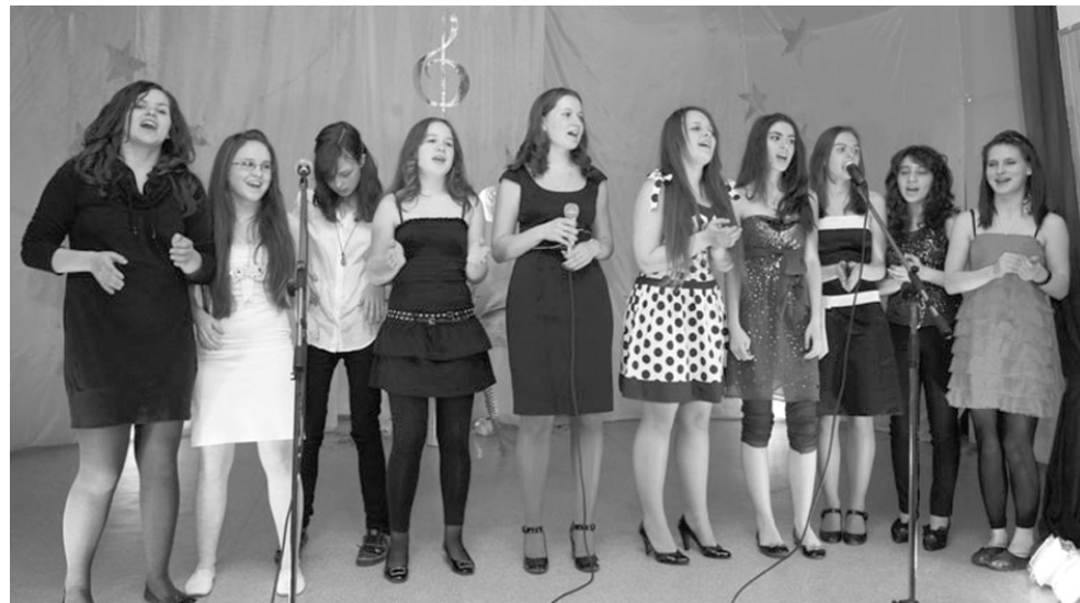
Участницы конкурса «Поющий звездопад»

9 апреля в актовом зале школы № 22 прошел конкурс юных талантов «Поющий звездопад», помогающий юным исполнителям не только испытать себя и лучше разобраться в выборе жизненного пути, но и на миг прикоснуться к заветной мечте.