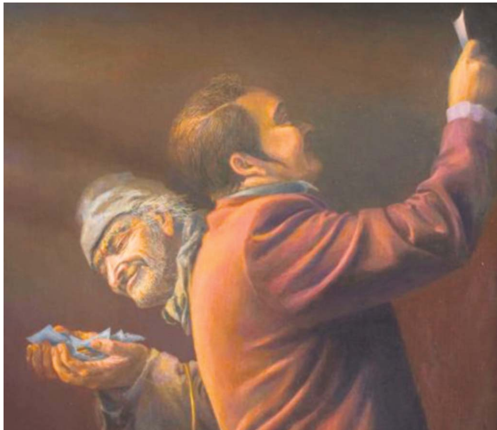
Иллюстрация к роману Н.В. Гоголя «Мертвые души» – холст, масло. Сергей Чайкун

Так, 1-я, 2-я и 6-я ревизии учитывали только «души мужского пола», остальные же – и мужского, и женского. Как правило, учет подлежали все категории податного населения (а их, согласно списку, подготовленному по окончании 3-й ревизии, насчитывалось более 100 наименований), традиционно объединяемые в более крупные группы крестьян (государственных, дворцо-