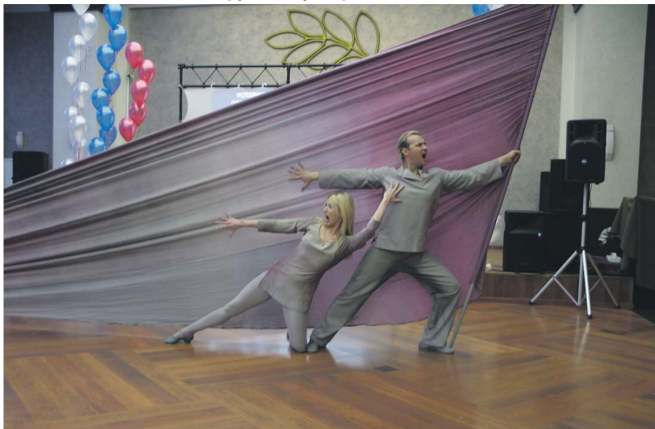
День общественных организаций. 17 февраля 2012 г.

ляло 1 272 человека, то в настоящее время – 1 453 человек.