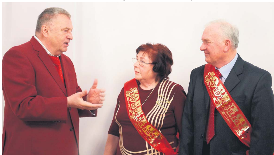
В.В. Жириновский поздравляет юбиляров

11 февраля ЗАГС Гагаринского района города Москвы посетил депутат Государственной Думы В.В. Жириновский. Владимир Вольфович поздравил новобрачных, принял участие в чествовании юбиляров «Золотой свадьбы» и в церемонии имянаречения.