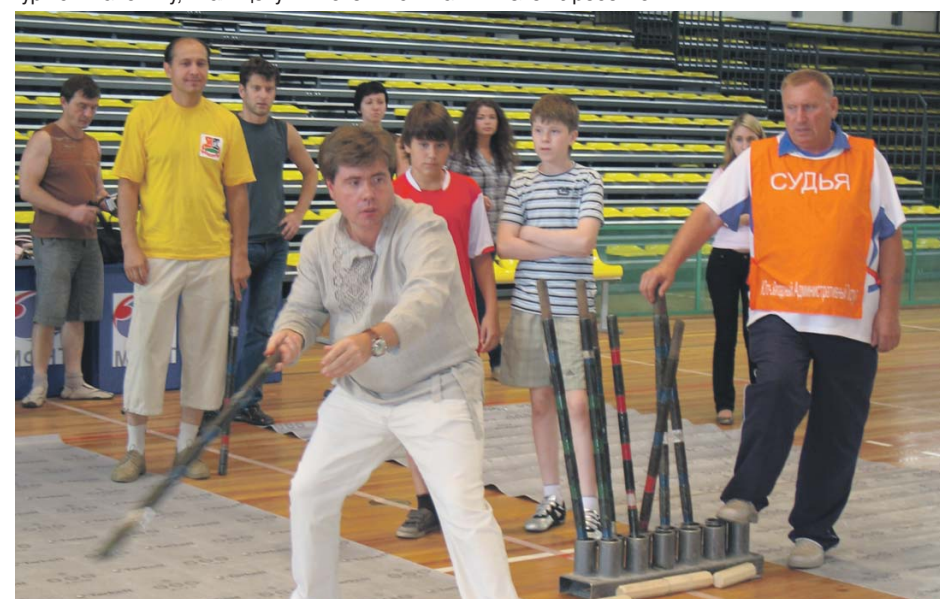
Соревнования по городошному спорту

За период работы в 2008-2012 гг. специалистами сектора опеки, попечительства и патронажа муниципалитета Гагаринский при осуществлении совместной работы с Комиссией по делам несовершеннолетних и защите их прав Гагаринского района по профилактике безнадзорности и социального сиротства был выявлен 1 случай жестокого обращения родителей с ребенком.