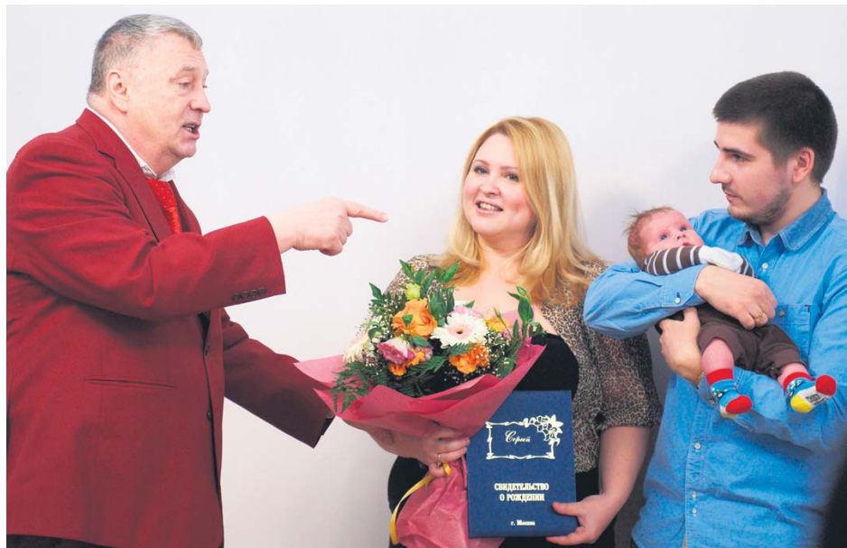
В.В. Жириновский участвует в церемонии имянаречения.