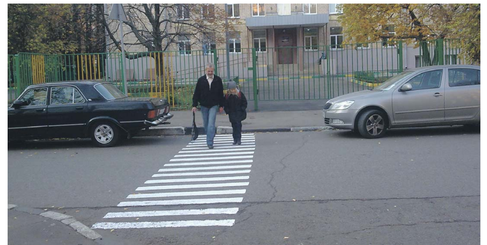
Один из пешеходных переходов (около школы № 192), созданных по инициативе руководителя ВМО Гагаринское Кобринского А.Л.

Муниципальное Собрание согласовало создание бесплатных парковочных мест общего пользования в 11 дворах нашего муниципального образования. В 3-х случаях заявления инициативных групп не были приняты к рассмотрению, так как был представлен не полный пакет документов. В одном случае после принятия решения о согласовании возникла конфликтная ситуация. Группа жителей обвинила своих соседей в неправомерности действий. Депутатский корпус обратился в Гагаринскую межрайонную прокуратуру с просьбой проверить законность действий инициативной группы, получившей согласование на организацию парковки от муниципального Собрании. По данным прокуратуры, в ходе проверки нарушений в деятельности инициативной группы выявлено не было. Следовательно, решение Собрании было принято объективно и правомерно, оно было оставлено в силе.