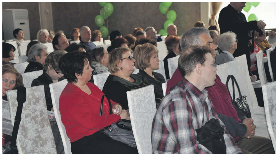
Жители на Дне общественных организаций. 17 февраля 2012 г.

Решением муниципального Собрании внутригородского муниципального образования Гагаринское в городе Москве были определены местные праздничные мероприятия, проведение которых финансировалось за счет местного бюджета: