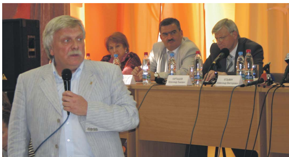
Публичные слушания по Генплану и правилам землепользования. 2009 г. Выступает председатель Москомархитектуры Кузьмин А.В. В президиуме (слева направо) – депутат муниципального Собрания Селихова Р.Н., глава управы Гагаринского района Твердохлебов А.Е., зам. префекта ЮЗАО Картышов А.Л.

В рамках рассмотрения проекта актуализированного Генерального плана развития города Москвы муниципальное Собрание направило в городскую комиссию по вопросам градостроительства, землепользования и застройки при Правительстве Москвы предложения по развитию территории внутригородского муниципального образования Гагаринское в городе Москве. Принятое решение от 24.06.2009 содержало 10 четких и конкретных предложений. В дополнение к этому решению Председателем муниципального Собрания Кобринским А.Л. было направлено письмо Председателю Москомархитектуры А.В. Кузьмину, содержащее 8 дополнительных предложений по актуализированному Генплану и 3 дополнительных предложения к Правилам землепользования и застройки.